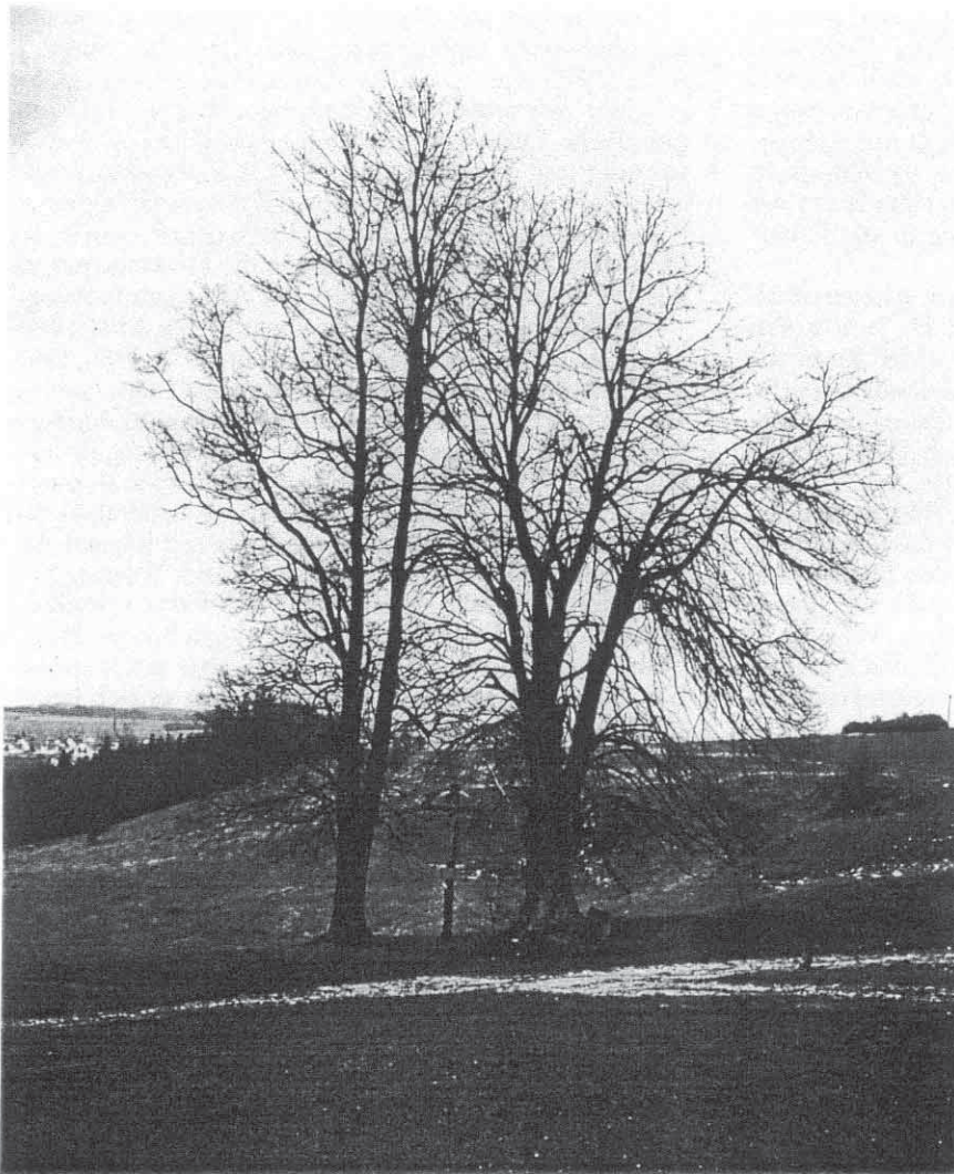
Orientierungsbäume mit Holzkreuz am Beginn der Steilabfahrt oberhalb von Deining der frühneuzeitlichen Trasse (16. Jh.) an der Fernstraße Regensburg-Neumarkt-Nürnberg

chivarbeit 2 bilden die Grundlage der Karte „Das Altwegenetz der südwestlichen Oberpfalz, die Routensysteme zwischen Regensburg und Nürnberg, Neumarkt-Parsberg und Dietfurt-Beilngries“.