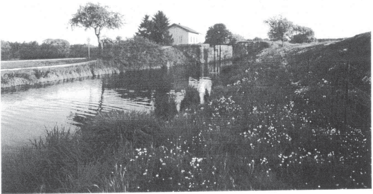
Ludwig-Donau-Main-Kanal mit Schleusenhäuschen