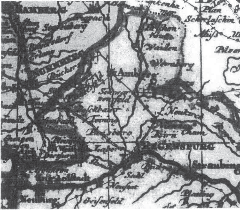
Der Thurn und Taxissche Postkurs Regensburg-Nürnberg um 1690

den Straßenzustand, welcher natürlich für unsere Zwecke besonders interessant ist.