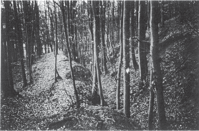
Teilansicht der Altstraße zwischen Sindlbach und Bischberg; tiefer Hohlweg im Eisensandstein; nicht sichtbar: Links weitere flachere Fahrinnen

Flurbereinigungsmaßnahmen verwischt worden. Nur selten sind sie als auf langer Strecke durchlaufende Feldwege, noch seltener mit Bezeichnungen wie „Rennweg“ oder „Hochstraße“, wie z. B. zwischen Kittenhausen, Großthundorf und Frettenshofen, erhalten geblieben.