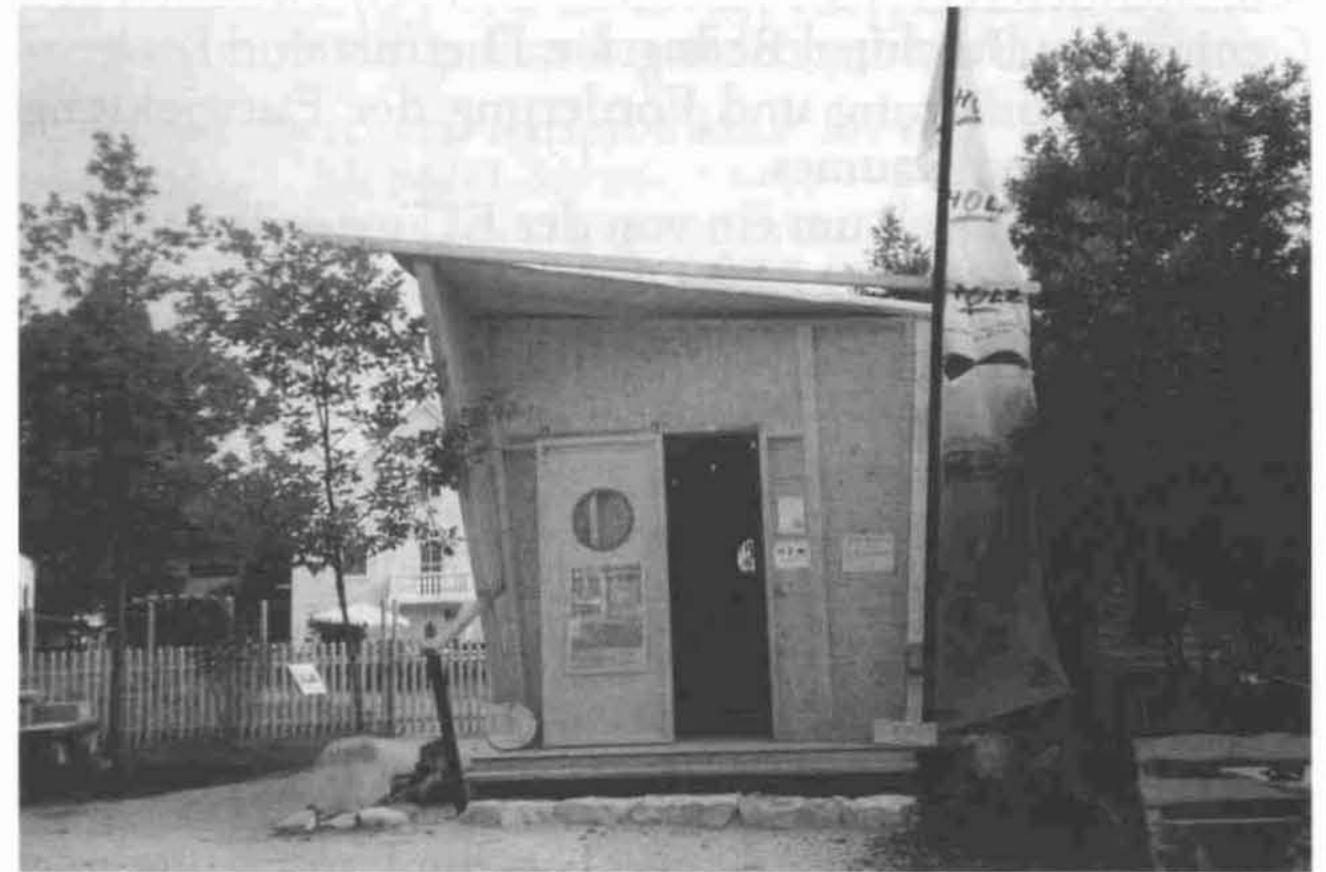
Ausstellungspavillon aus heimischem Holz. Interessengemeinschaft Holz aus der Region